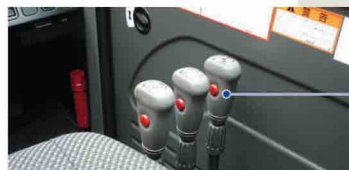
グリップ スイッチ