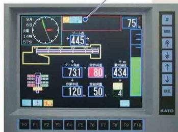
ACS表示部 「ブーム起伏低速」