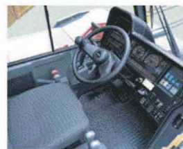
液体封入式サスペンション付キャブ